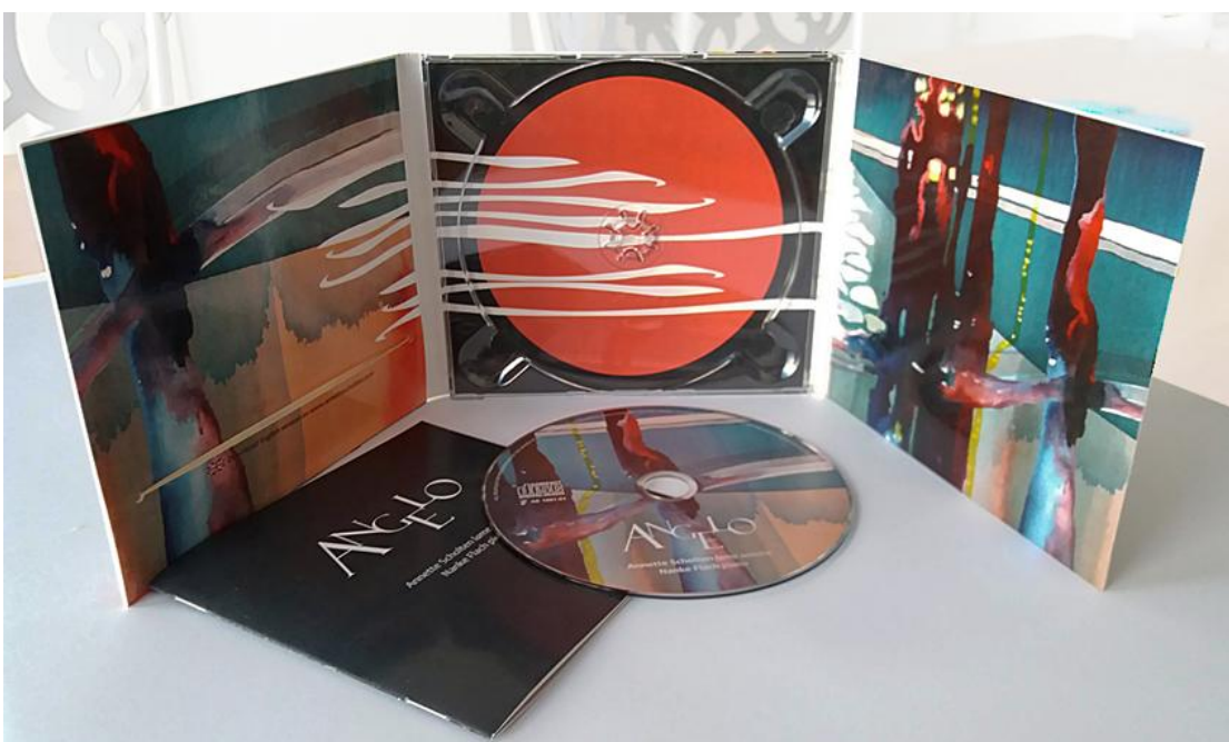
CD 3-luik doosje, boekje en schijfje. Ontwerp Gea Zwart, januari 2018