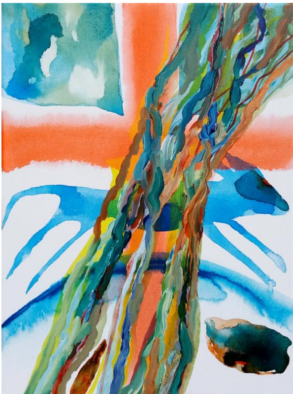
Kleintjes: 'Ready for the next phase. Running animal' 30x40 cm., acryl op linnen, Gea Zwart, dec. 2017

In mijn webshop op mijn website heb ik verschillende vaste items: