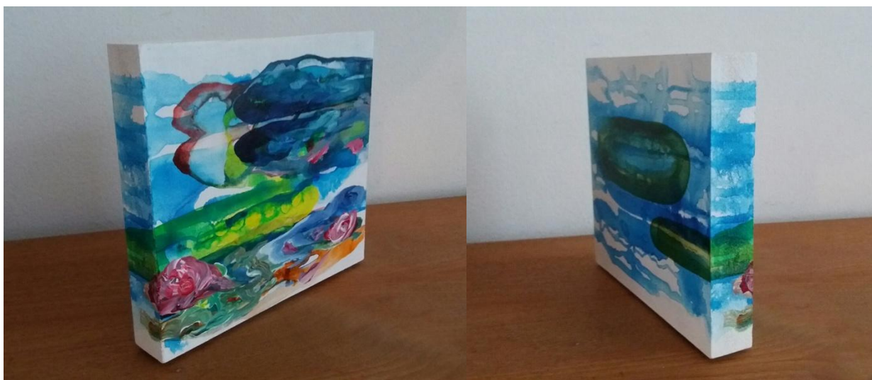
'Stromend blok leven', blokpaneeltje 20x18x2 cm, acryl op mdf hout, met pootjes, Gea Zwart oktober 2017