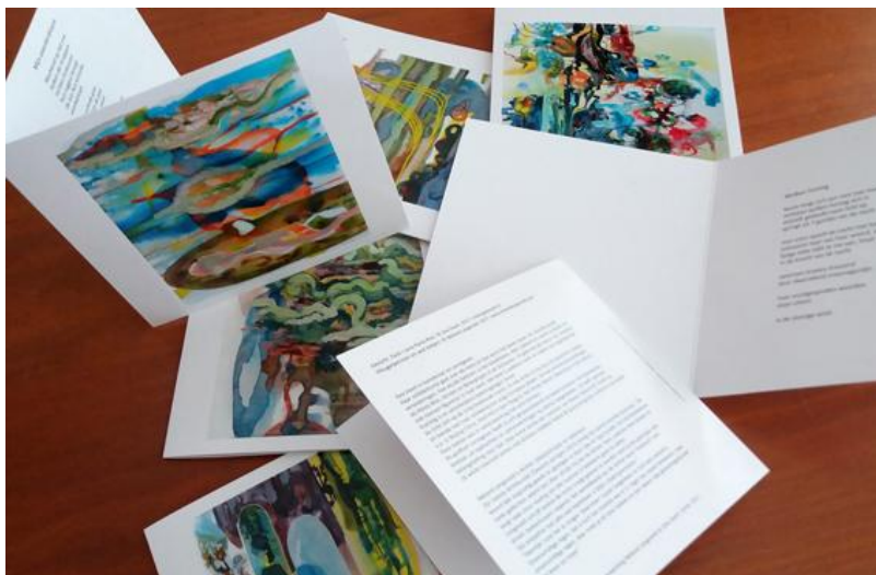
Set 8 Ansichtkaarten, kunst voorop, poëzie binnenin, info. over de makers achterop.

Bestellen via: http://www.geazwart.nl/WEBSHOP.html