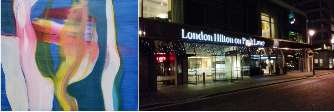
'Parfum', 100 x 120 cm., olieverf op doek