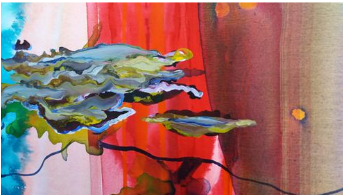
Detail schilderij 'Composition Dawn', Gea Zwart

Op mijn facebookpagina heb ik een album aangemaakt, waar ik detail foto's van mijn schilderijen plaats. Want de wereld van dichtbij is er ook!