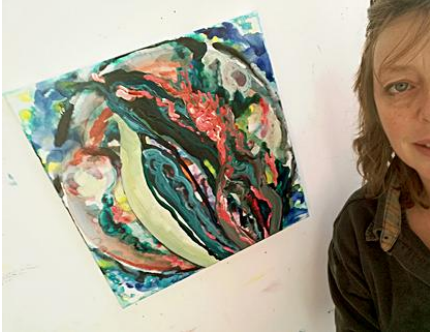
Kleintjes: 'Over ontwikkeling, groei, duisternis, licht en de bloedmaan', 40x40 cm., acryl op linnen, Gea Zwart, feb. 2018

Webshop http://www.geazwart.nl/WEBSHOP.html