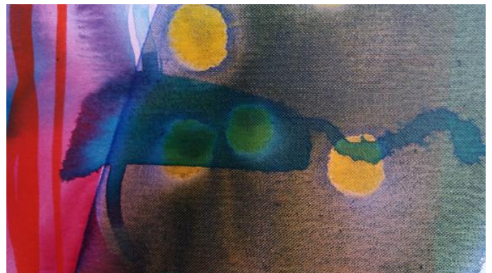
Winterlicht in mijn atelier, februari 2018 Detail schilderij 'Composition Dawn' Gea Zwart